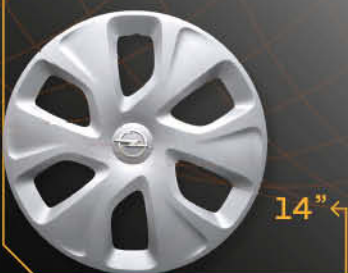
• 5917/4 Kar1