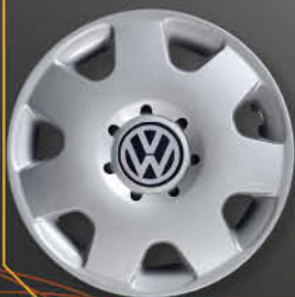
• 6005/4 Polo base '03