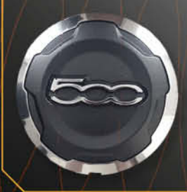
• 1313 Coppetta 500 L '12