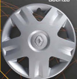
• 5721/4 Clio '01 Scenic '00