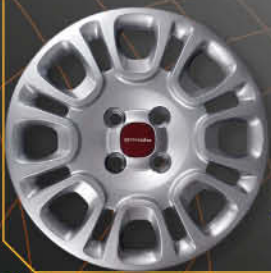
• 1309 Panda Easy 2012