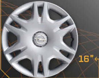
• 5910/6 Corsa '06