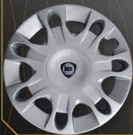
• 4284 Y LS 2^ serie