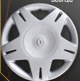
• 5723/3 Clio '01 Scenic '00