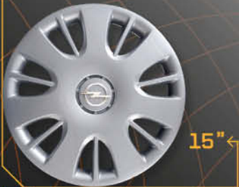
• 5909/5 Corsa '06