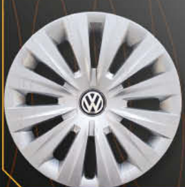
• 6017/5 Golf serie 7