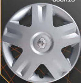
• 5722/3 Clio '01 Scenic '00