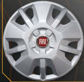
• 1315 Fiat Ducato '14