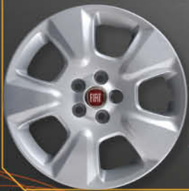
• 1306 Doblò 2010