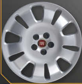
• 1307 Doblò 2010