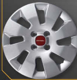
• 1308 Panda Pop 2012