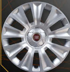
• 1317 Tipo 2016