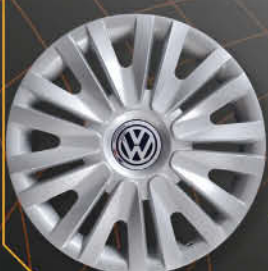
• 6010/5 Golf V