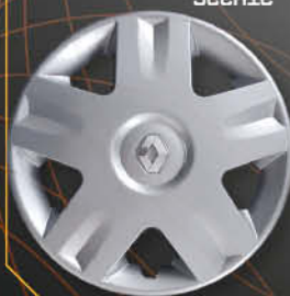
• 5722/4 Clio '01 Scenic '00