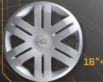
• 5912/6 Vivaro