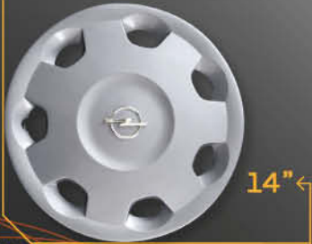
• 5905/4 Corsa base