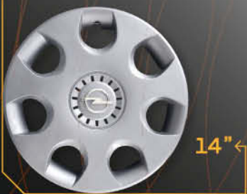
• 5913/4 Agila '08