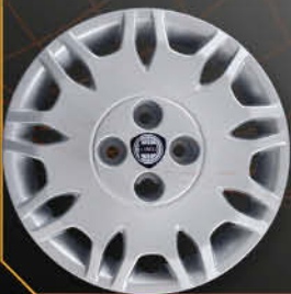
• 4286 Nuova Y Fashion