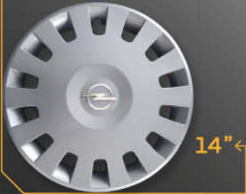
• 5906/4 Corsa confort