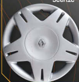
• 5724/4 Clio '01 Scenic '00