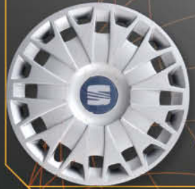
• 6204/5 Ibiza 2008