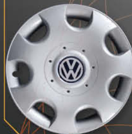
• 6008/6 Golf V