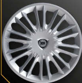
• 4289 New Ypsilon Oro