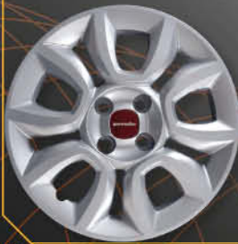
• 1310 Panda 4x4 2012