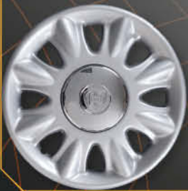
• 4277 Delta '98