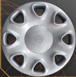
• 4279 Delta 16V '98