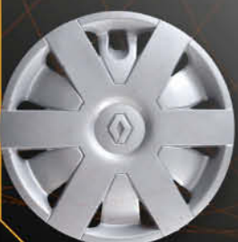
• 5725/4 Laguna '98