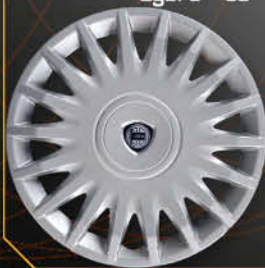
• 4287 Nuova Y Oro Lybra '99