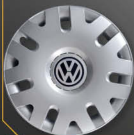
• 6006/4 Polo confort '03