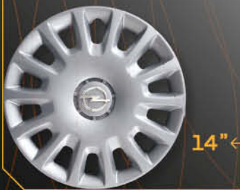
• 5915/4 Corsa '06