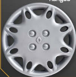
• 5702/3 Clio '98 Kangoo '97