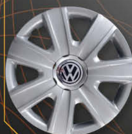
• 6014/4 Polo 2009