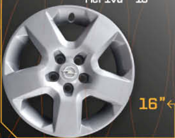
• 5914/6 Vectra Astra Meriva '10