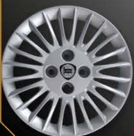
• 4288 New Y Argento