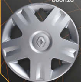
• 5721/3 Clio '01 Scenic '00