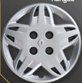
• 5701/4 Clio '98 Kangoo '97