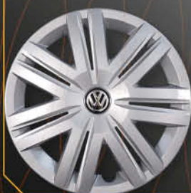
• 6016/4 Polo 2014