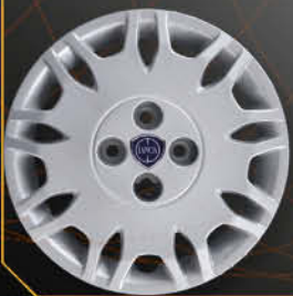
• 4286LC Nuova Y Fashion