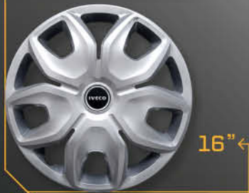
• 5100 Daily 2014