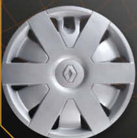
• 5725/3 Laguna '98