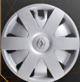
• 5726/3 Laguna '98