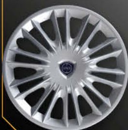
• 4289LC New Ypsilon Oro 2008