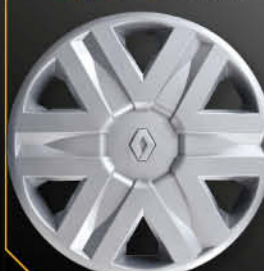
• 5729/5 Scenic