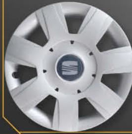
• 6203/6 Leon