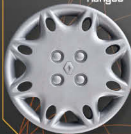
• 5702/4 Clio '98 Kangoo '97