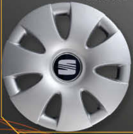
• 6201/4 Ibiza Cordoba Signo