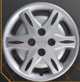
• 4280 Y Base