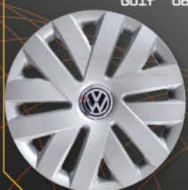
• 6011/5 Polo '09 Golf '08