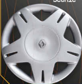
• 5724/3 Clio '01 Scenic '00