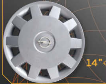
• 5908/4 Agila