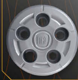
• 1314 Coppetta DUCATO '07>