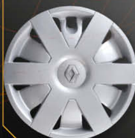
• 5726/4 Laguna '98