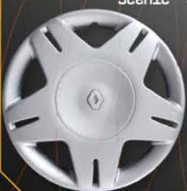
• 5723/4 Clio '01 Scenic '00