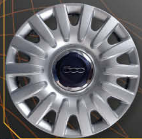
• 1311 500 L 2012