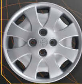
• 4281 Y LS