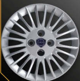
• 4288LC New Y Argento 2008