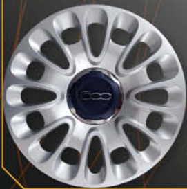
• 1312 500 L 2012