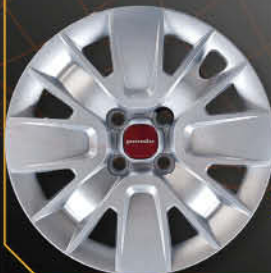
• 1316 Panda 2016