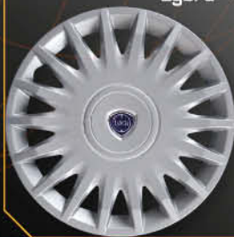
• 4287LC Nuova Y Oro Lybra '99