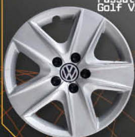
• 6012/6 Touran '05 Passat '06 Golf VI '09