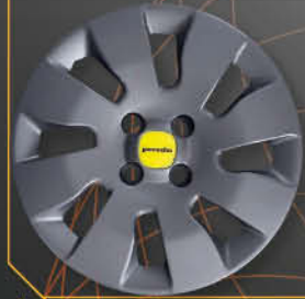
• 1308NR Panda Young