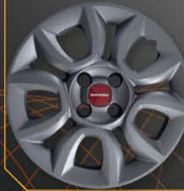
• 1310NR PANDA 4X4 CROSS