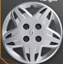
• 5701/3 Clio '98 Kangoo '97