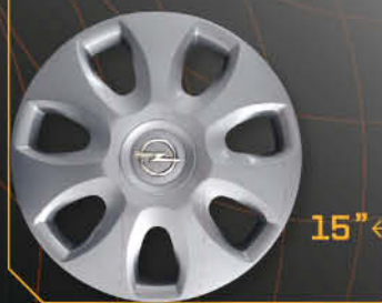
• 5916/5 Corsa '06