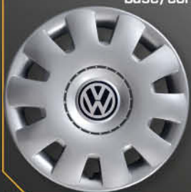
• 6007/5 Golf base/confort