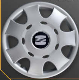
• 6202/4 Ibiza Cordoba Stella