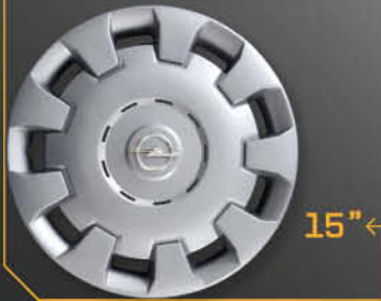
• 5907/5 Astra '04