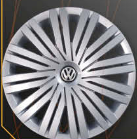
• 6015/5 Golf VII '14