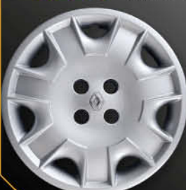
• 5728/5 Laguna '98