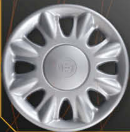
• 4282 Y LX