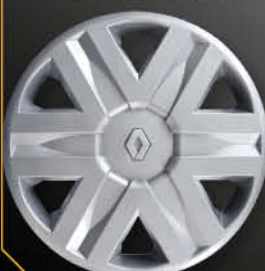
• 5729/3 Scenic