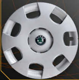
• 6301/4 Fabia