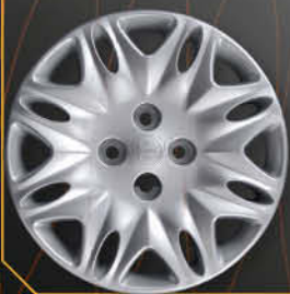
• 4283 Y Elefantino