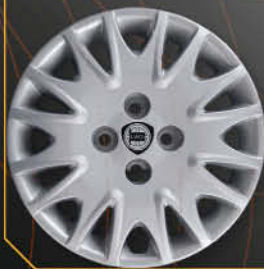
• 4285 Y Elefantino 2^serie