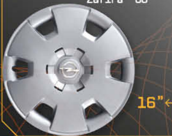
• 5911/6 Astra '05 Zafira '06